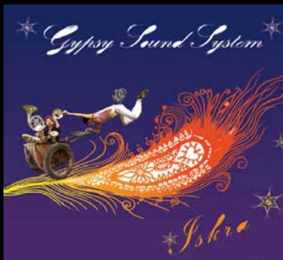
Album «Iskra» 2009, compilation.